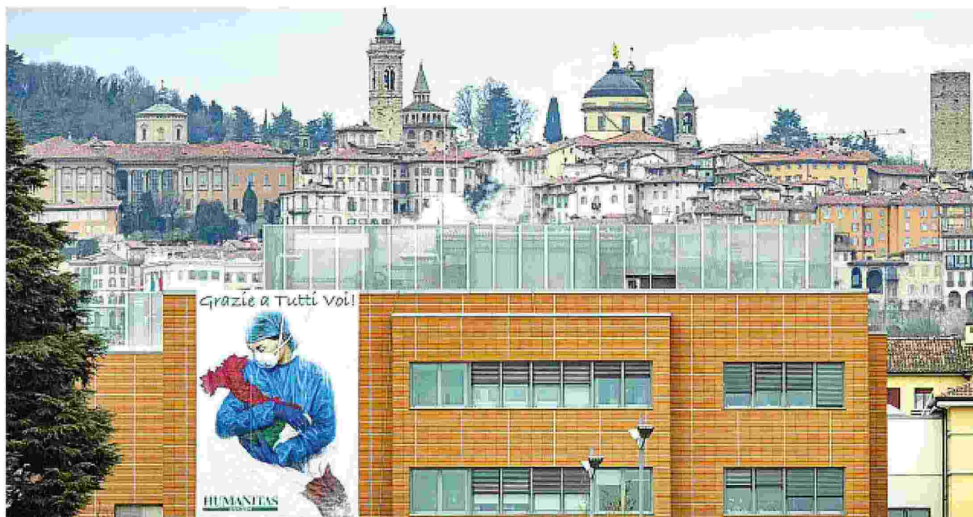
Il simbolo La gigantografia di solidarietà con medici e infermieri esposta all'Humanitas Gavazzeni di Bergamo, una delle aree più colpite dal virus in Italia